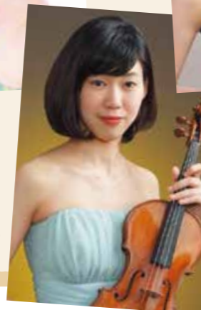
大谷桜子 (ヴァイオリン)