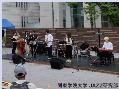
関東学院大学 JAZZ研究部

歴史と文化のまち横浜は、今刻々と新しく生まれ変わろうとしています。そして、横浜・都心臨海部には、近年、大学を中心とした若い力も多く集結してきました。そこで、そんな未来にはばたく学生たちと一緒にまちを盛り上げたい、ガス灯のように地域を明るく照らしたい、という気持ちで、今年もガス事業発祥の地である馬車道で、地域共創型のコンサートをを行います。