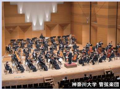
神奈川県立 管弦楽団