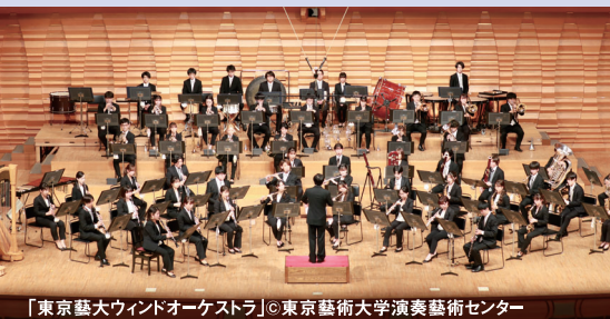
「東京藝大ウィンドオーケストラ」◎東京藝術大学演奏芸術センター

18:30開演(17:30開場)全席指定 無料招待 往復はがき応募 1応募2名まで(抽選)※未就学児入場不可